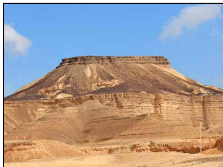
הר ארדון (מצוק משוכב וחול צבעוני)