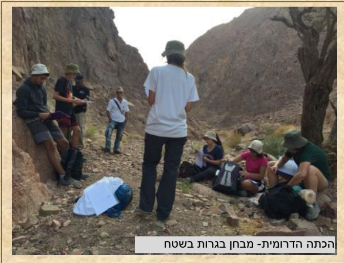
הכתה הדרומית- מבחן בגרות בשטח

שת"פ אזורי – גיוס תמיכה ומעורבות של בעלי עניין במרחב.