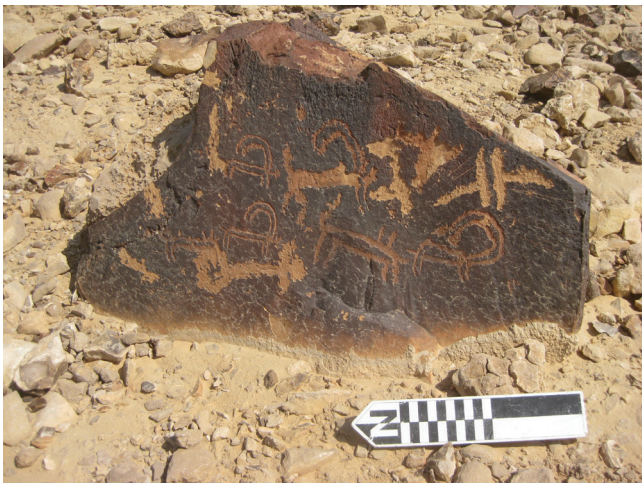
איור 5: חרותות של דמויות בעלי חיים, ועליהן גיבוב ואסם בהר כרכום

בעוד הוואסם מעביר מסר של בעלות, מיקומו הלא-אקראי לצד סימונים קודמים מצביע על זיקה אל השרידים הגרפיים שהושארו על ידי שוכניו ההיסטוריים של האזור. נראה כי המבצעים הבדואים נמנעו במכוון מלשלב דימויים קודמים. מכאן ניתן להסיק שהוספתם של הסימנים החדשים מרחיבה את משמעות המסרים המקוריים. לדוגמה, פאנל מהר כרכום מציג בעלי חיים לא מבויתים הנרדפים על ידי חיות טרף. הדמויות מייצגות ככל הנראה יעלים בסביבתם הטבעית, סצנה שעשויה הייתה להתרחש בקרבת מקום (איור 5). שנים מאוחר יותר צורף ואסם נוסף לחריטה זו, במה שנראה כניסיון של האמן להביע את שליטתו על אוצרות טבע אלה.