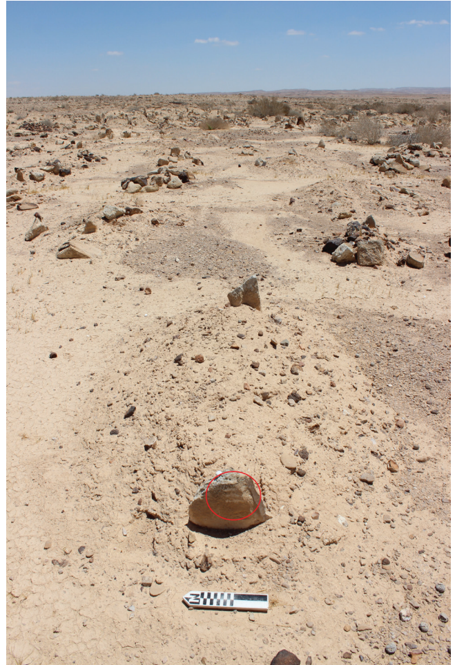
איור 6: ואסם על מצבת קבר בבית הקברות הבדואי בסמוך לעזון

יש לציין כי אף שהבדואים מבינים את הוואסם כמגדיר בעלות, סמלים אלה אינם מוכרים ואינם מובנים לבני תרבות אחרת. אף על פי שכבר אינם בשימוש יומיומי, עדיין אפשר לראות ואסמים במרחבי הנגב. כך, בביקור בבית קברות בדואי בקרבת היישוב עזון, זיהה אחד המחברים ואסמים שונים בכמה מצבות, עדות לנוכחותם של כמה שבטים בתא שטח מסוים בזמן היסטורי חופף (איור 6).