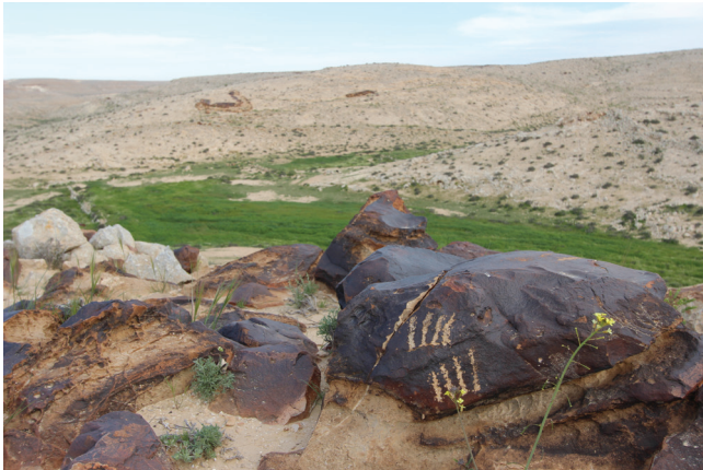
איור 4: סלע ועליו ואסמים במיקום המשקיף על חלקה חקלאית ומרעה ברמת מטרד

גרפיטי, ואסמים משמשים כקוד משותף שבאמצעותו מסמנים על פי רוב בעלות או זכאות (Hilden, 1991). עבור בדואי המכיר את הסביבה המדברית, ואסמים היו כמו שלט התלוי על עמוד השער ומודיע למבקרים מה הפרוטוקול שעל פיו יש לנהוג במקום מסוים. חרותות סלע אפשרו לבדואים לקיים תקשורת בין-שבטית וכך לבטא את שליטתם על משאבי הטבע היקרים של הסביבה השחונה, גם מבלי להיות נוכחים באותו מקום ובאותו זמן עם הנמענים, וגם מבלי לדעת קרוא וכתוב (איור 4).