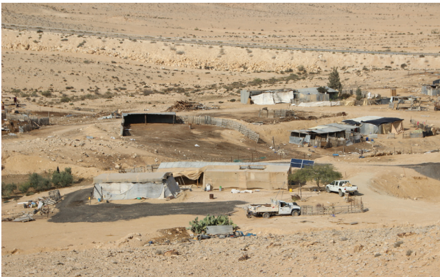
איור 2: התיישבות בדואית לא מוכרת בהר הנגב

במשך הזמן הקימו הבדואים מחנות מאולתרים בשטחים שטענו לבעלות עליהם או בסמוך אליהם. במהלך ארבעת העשורים האחרונים וכתוצאה משיעור הילודה הגבוה בקרבם (ב-2012 היו בנגב 210,000 בדואים), הפכו המאהלים ליישובים קטנים (Myers-JDC, Brookdale Institute, 2012). כפרים אלה מוגדרים על ידי הממשלה כ"בלתי חוקיים" או "בלתי מוכרים", ולכן אינם זכאים לתשתיות או לשירותים בסיסיים (איור 2) (Rudnitzky, 2012). מעבר הבדואים מאורח חיים של שוכני מדבר נוודים למחצה ליישוב קבע מבוססת ערים הביא לסיום הפעילויות המסורתיות: רעייה נוודית וחקלאות מי נגר ודפוסי קיום, שעשו שימוש באמנות סלע כאמצעי להכרות בעלות על קרקעות משפחתיות או שבטיות תוך כדי שימוש בנוף משותף.