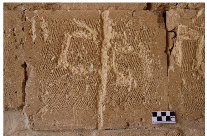
איור 3: ואסם בדואי על קיר מערת עין נוסרה בעבדת

הוואסם ככל הנראה התפתח מסימון גמלים בצריבה בידי הבדואים, והפך לסמל המשמש לצורך סימון גבולות בין שטחים וקברים, וכן לציון בעלות על רכוש כגון אוהלים ואתרי חנייה (Bates, 1915; Bent and Bent, 1900; Conder, 1883; Field, 1931; Hilden, 2010; Khan, 2000; Wendrich, 2008; Wilkinson, 1977). ניתן לצייר ואסמים בחול או להרכיבם מאבנים וממקלות, לצבוע או לחרוט אותם על אבני פי באר, על חורבות, מבנים וסלעים, ואף לשלבם באריגה של שקי אחסון ומחיצות אוהל (איור 3).